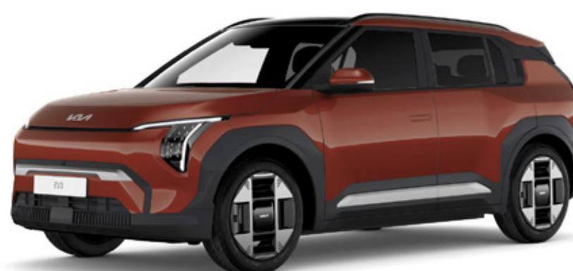
Terra cotta (TCT)