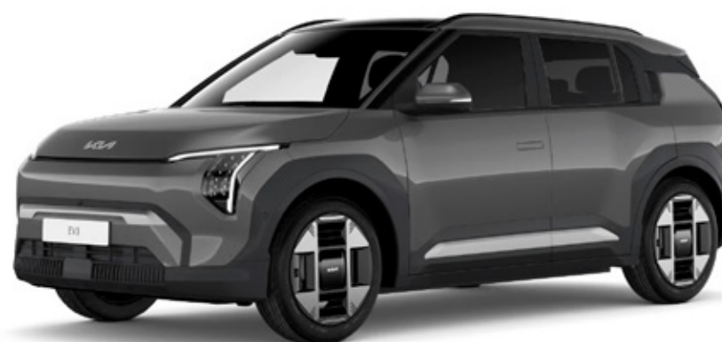
Shale grey (EBD)