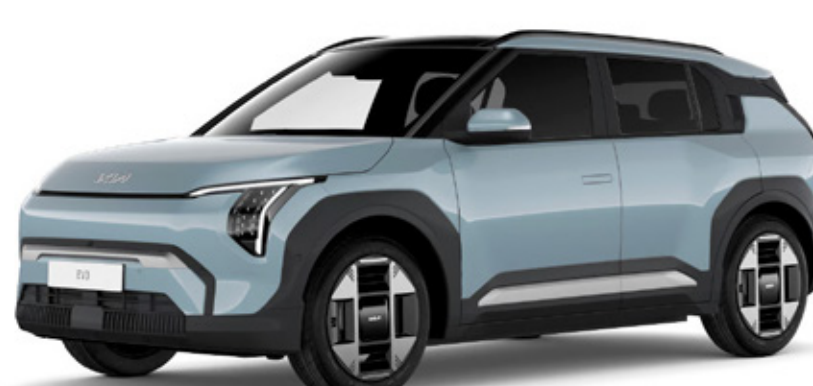
Frost blue (EBB)