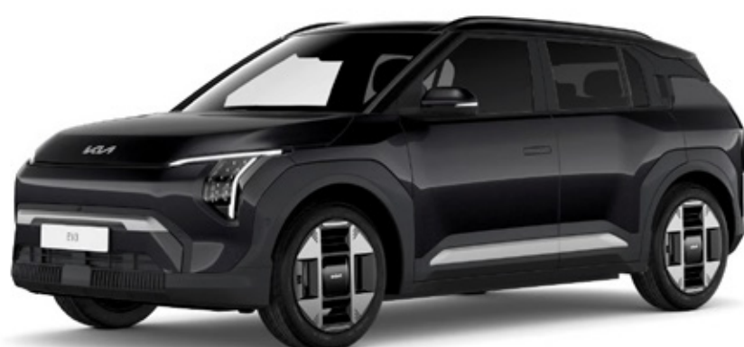
Aurora black pearl (ABP)