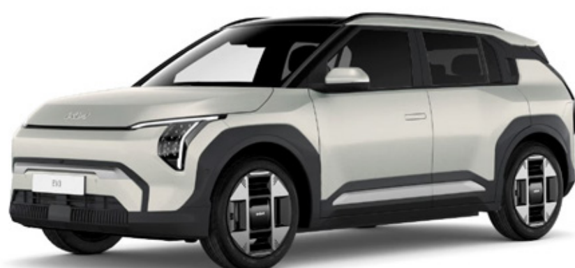
Ivory silver (ISM)