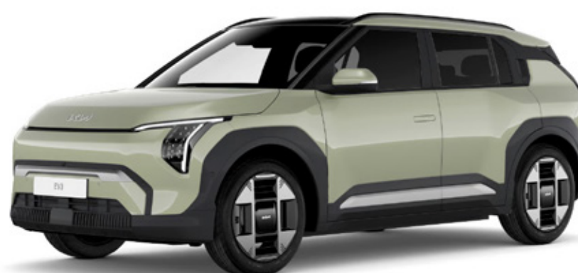
Aventurine green (AG3)

* Las especificaciones pueden variar sin previo aviso.