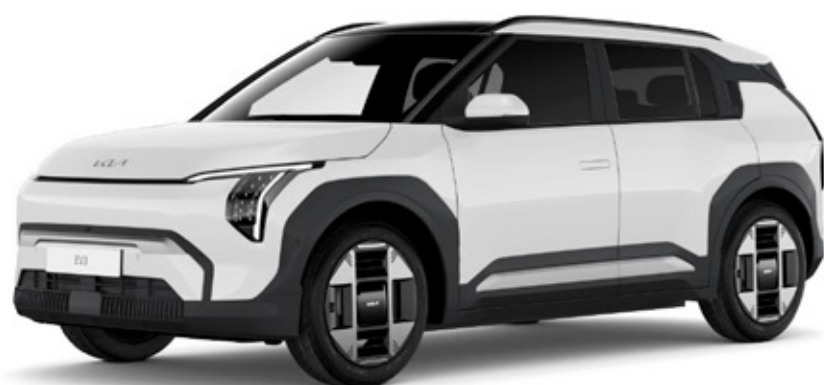
Snow white pearl (SWP)